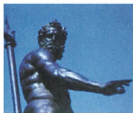
Statua del Nettuno (Piazza Maggiore)