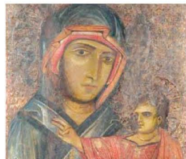
Madonna di S. Luca